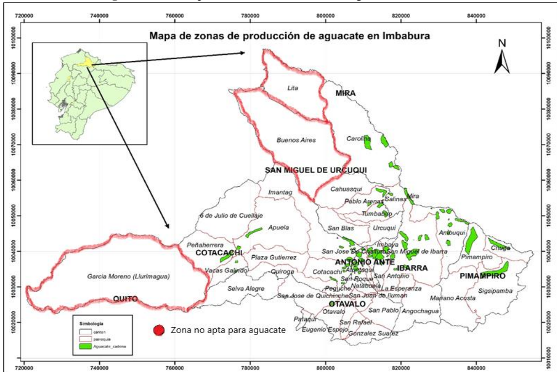
Figura 1: Zonas productoras del cultivo de aguacate en Imbabura

Elaborado por: Equipo consultor, 2020.